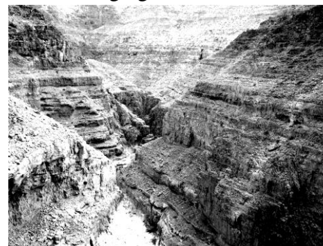
Voorbeeld van Wadi Watir.

Númeri 33:8 'En hulle het van Pi-Hágirot af opgebreek en dwarsdeur die see gegaan na die woestyn toe...en laer opgeslaan in Mara.' Hulle het vir drie dae geen water gevind nie. En toe hulle by Mara kom vind hulle water maar die water was so bitter dat hulle dit glad nie kon drink nie. Moses het op bevel van die HERE 'n stuk hout in die water gegooi en die bitter het weggegaan en hulle kon dit drink. Die woord 'dwarsdeur' is 'n sterk woord wat die dringende swaar beweging van die trekkers beklemtoon. Dit word verder versterk